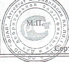
Схема сертификации: 1

Назначение: Для обустройства детских игровых площадок и парковых зон в соответствии СНТД и проектной документацией